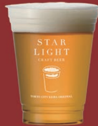
ゴールデンエール