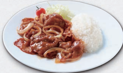
国産ブランド豚 生姜焼きプレート ¥1,650