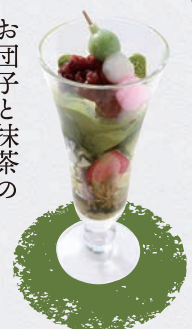
季節のパフェ(抹茶) ¥1,100