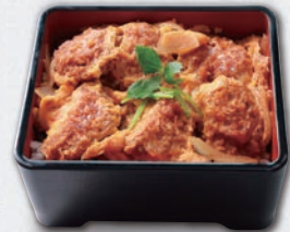
三元豚 ヒレかつ重 ¥1,650