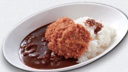
三元豚 ヒレカツ カレーライス ¥1,650