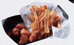
ちぎり揚げ& ごぼうチップ ¥880