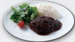
国産牛と淡路島産玉ねぎの ハンバーグプレート ¥1,850