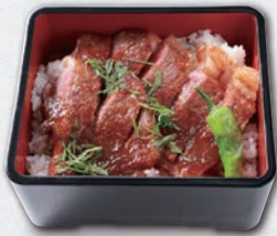
サーロイン ステーキ重 ¥2,900