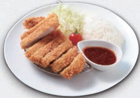
国産ブランド豚 ロースカツプレート ¥1,850