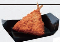
大きな アジフライ ¥680